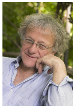
Roland Moser © DR