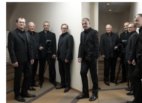
Quintette à vent Slowind

Tarif normal : 20 francs Tarif réduit : 15 francs (AVS, AI, étudiants, chômeurs, abonnés Le Courier et L'Agenda , membres Sonart ) Tarif jeune : 15 francs (étudiants, apprentis, jeunes de moins de 20 ans) Carte 20ans/20francs : 15 francs Tarif préférentiel : 5 francs (élèves FEGM, étudiants HEM, étudiants en musicologie de l'Unige) Nous acceptons le Chéquier culture.