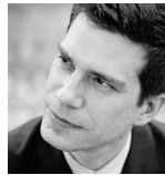
Samuel Andreyev