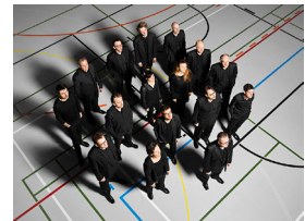
Ensemble Contrechamps