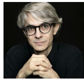
Alberto Posadas