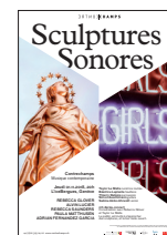
Affiche du concert © Base Design GVA