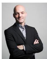
Thierry Debons © Alain Kissling