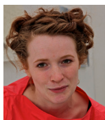
Rebecca Glover © Nigel Clifford