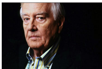
Robert Ashley