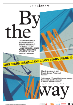
Affiche du concert © Base Design GVA

Tarif normal : 28 francs Tarif réduit : 18 francs (AVS, AI, étudiants, chômeurs, abonnés Le Courrier ) Tarif jeune : 18 francs (étudiants, apprentis, jeunes de moins de 20 ans) Carte 20ans/20francs : 15 francs Tarif préférentiel : 5 francs (élèves FEGM, étudiants HEM, étudiants en musicologie de l'Unige) Nous acceptons le Chéquier culture.