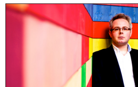
Clement Power