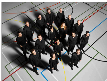
Ensemble Contrechamps